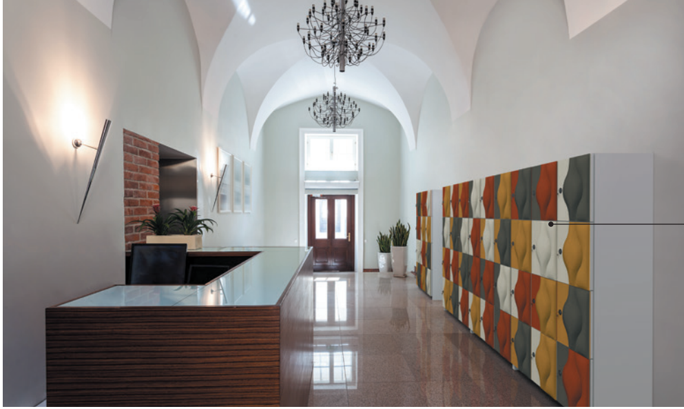
Model 'Tone' | kleurenpalet Sunset: