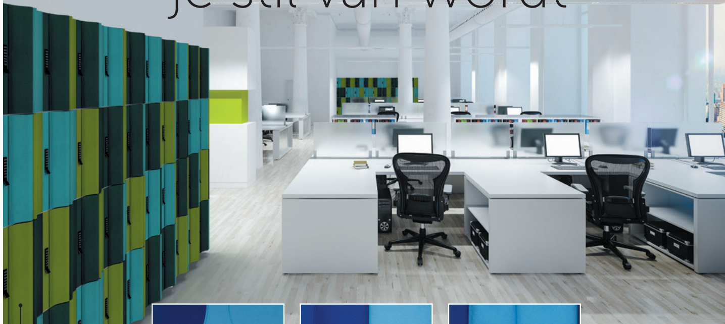
Model 'Wave' | kleurenpalet Woods: