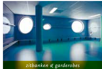
zitbanken & garderobes